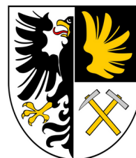
URZĄD MIEJSKI W TARNOWSKICH GÓRACH