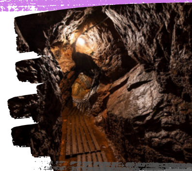
Kopalnia złota "Aurelia" w Złotoryi