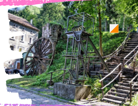
Skansen Górniczo-Hutniczy w Leszczynie

Złotoryja - najstarsze miasto w Polsce. Pod koniec XII wieku zaczęto wydobywać na jej terenie złoto (z łac. aurum - stąd także nazwa mapy "Aurelia" - od kopalni złota). W Złotoryi organizowane są co roku Mistrzostwa Polski w płukaniu złota.