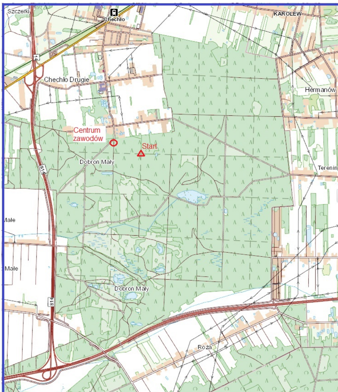
Lokalizacja centrum zawodów

Sposób potwierdzania PK: na kartach startowych oraz za pomocą chipów SI.